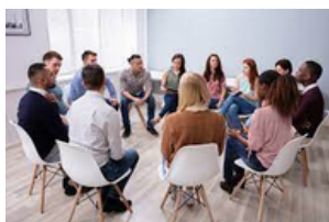
Groupe de Parole